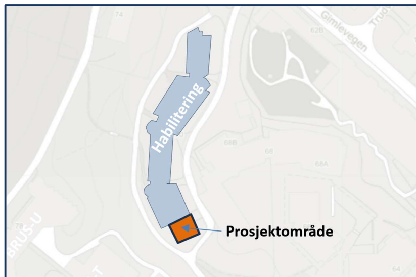
Bilde 3. Habilitering (Gimleveggen 70) – Lokalisering av prosjektområdet

Ombyggingen vil bli utført i bygningen i drift. Alle korridorer og tilgrensende rom er i bruk for pasientbehandling.